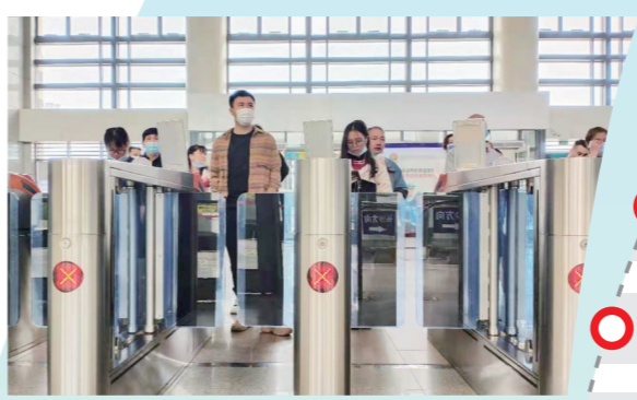
▲乘坐城铁出行,成为不少市民跨城的新选择。

5月24日上午11点,记者来到城铁大丰站。城铁公交化运行,首先体现在乘车购票的便捷。目前,长株潭城铁已支持使用“铁路12306”App注册、开通“铁路e卡通”。开通后就可以像乘坐公交车一样扫码进站,不用每次提供身份证,也不需要提前购票。城铁的便捷度也可以在发车密度上看出,从这里开往长沙的城铁有很多趟,每一趟的间隔基本是20分钟左右。从大丰站到长沙火车站的公路距离约55公里,记者购买了一张S7824次城铁列车车票,11点38分发车,12点32分抵达。