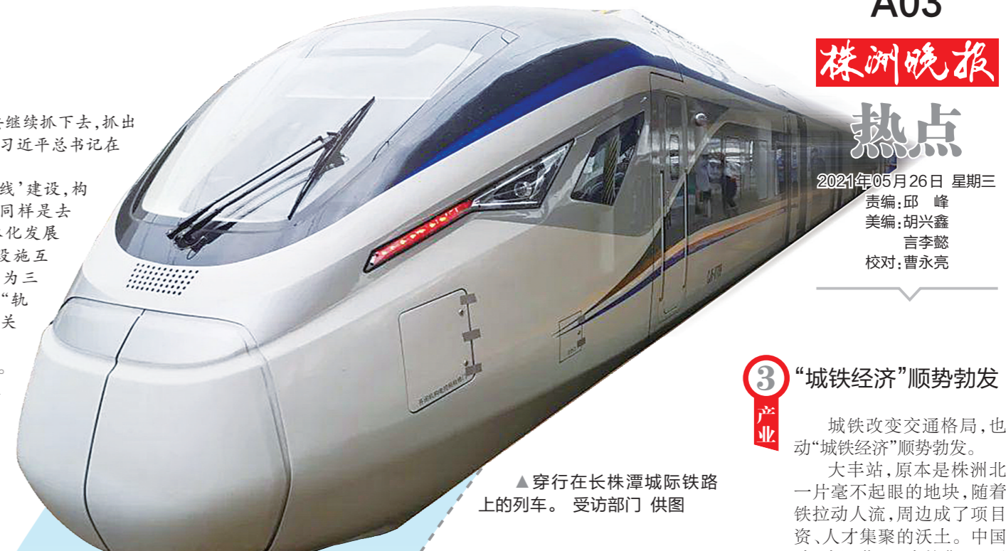
▲穿行在长株潭城际铁路上的列车。

“长株潭一体化发展要继续抓下去,抓出更大成效。”这是去年9月,习近平总书记在省考察时的明确指示。“加快‘三干两轨四连线’建设,构建‘半小时通勤圈’……”同样是去年9月,《长株潭区域一体化发展规划纲要》发布,从基础设施互联互通、产业协同等方面为三市融城擘画出美好蓝图,“轨道上的长株潭”成为各界关注的焦点。