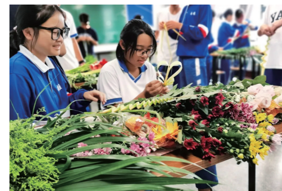
▲美育插花课上,学生将艺术审美和创意思维融入到作品之中