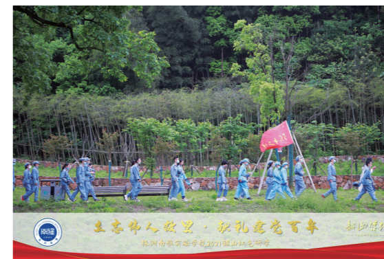
▲学校组织的2021年红色主题研学活动