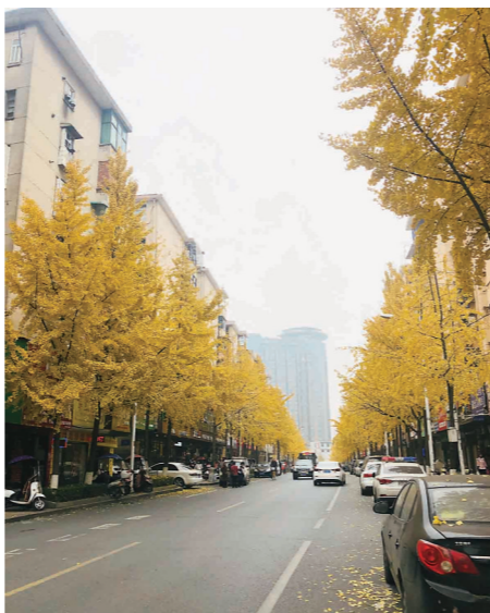
▲秋天,银杏夹道的钻石路(资料图)。

的繁荣。潘姨,二十多年前就在钻石路上经营着这家理发店,一晃二十多年过去,她已年近花甲。 “再怎么剪,也剪不完越来越多的白头发。”潘姨靠着这家店,供完孩子上大学,又看着孩子成家立业。二十多年过去,她的手法依旧娴熟,老顾客登门不断,“以前很多在这里理发的小孩子,现在都带着自己的孩子来理发了。” 2002年以后,工厂细分业务,成立株洲钻石切削刀具股份有限公司,厂区设在河西,不少老顾客也随之搬了家。“尽管快二十年了,但是还有人专门从河西开车过来,就是为了找我理发。”潘姨说。