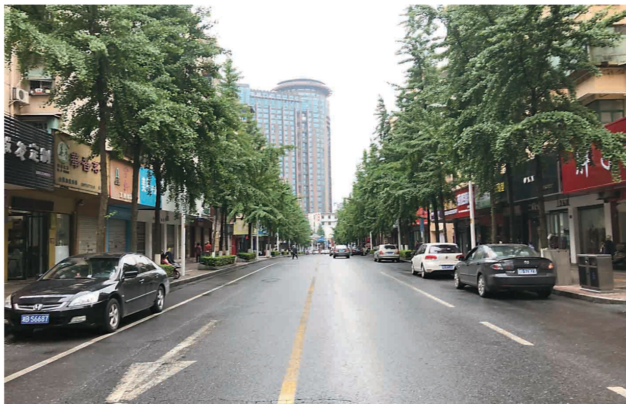
▲连接厂区与新华西路的钻石路。

路名:钻石路 规格:长810米,宽12-18米 位置:位于荷塘区,始于株洲硬质合金集团有限公司,交汇芙蓉塘路,终于新华西路 改造时间:2011年8月开工,同年12月竣工