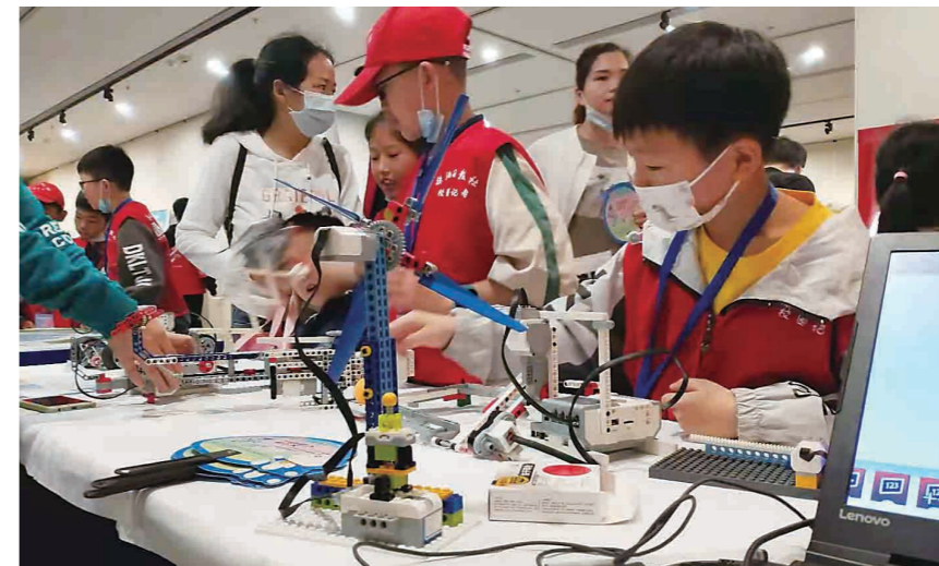
▲第五届株洲科技嘉年华现场。

本报讯(株洲晚报融媒体中心记者 廖智勇)看无人飞行器表演、现场听专家讲解子弹头列车、操纵“机甲大师”战斗……5月23日上午,2021年株洲市科技活动周暨第五届中小学生学习嘉年华活动吸引了近5000名孩子。家长来现场打卡,琳琅满目的科普展品和超赞的实操体验让孩子们大呼过瘾。