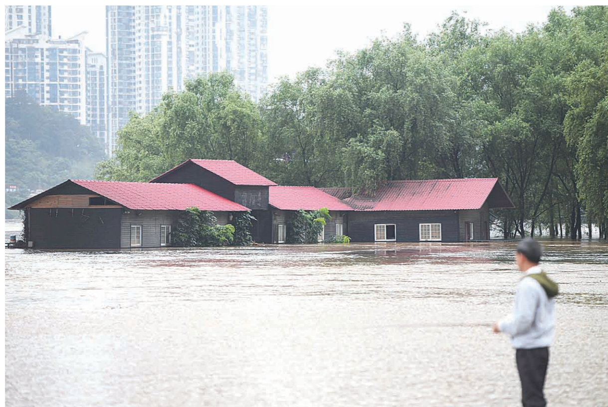
▲5月20日上午,湘江水位上涨,四桥下的房屋已被洪水浸泡。

市档案馆相关负责人表示,市档案协会作为政府与企业的桥梁和纽带,将把握好正确的政治方向,唱好学术研究的主旋律,为市民提供更为详细的档案资料,为市民查询档案提供更多便利。