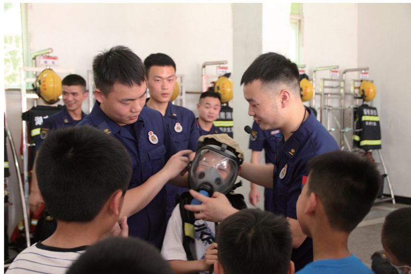
▲在消防员叔叔的帮助下,孩子们当上了“小小消防员”。

在第31个全国助残日这个特殊的日子里,这场主题活动促进了残健共融,传播友善、互助、感恩、向上的正能量,让孩子们从小培养安全意识,感受到消防官兵的关