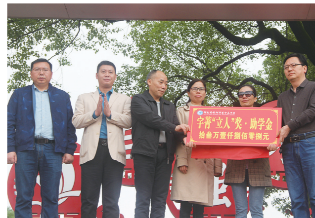
▲宇菁“立人”奖助学金捐赠仪式现场。

然而这个夏天,她的梦想再也无法实现了。仅仅19天,无情的病魔还是带走了这个热情开朗的姑娘。