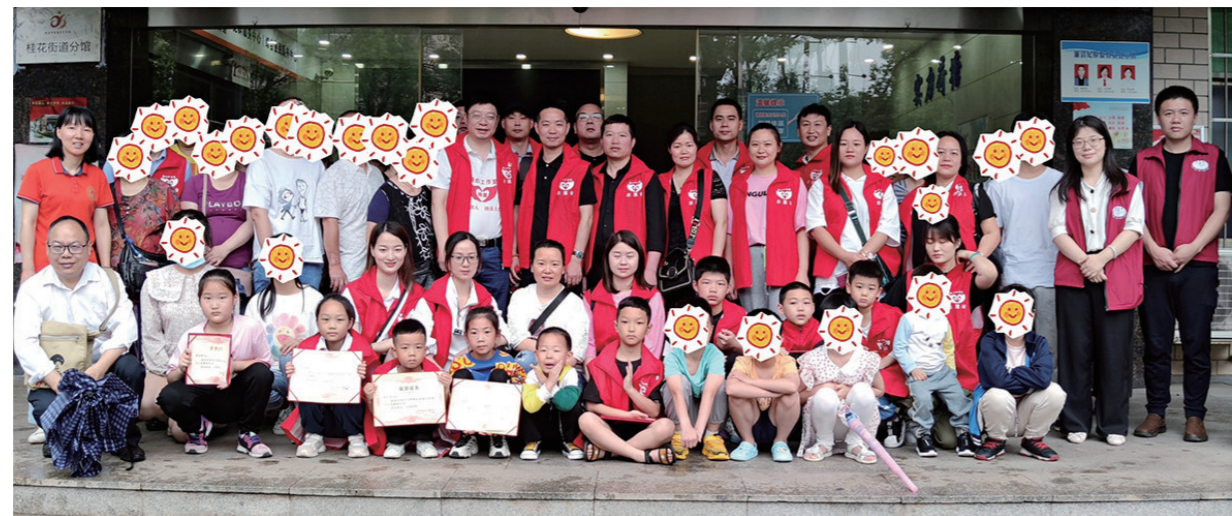
▲爱心人士助力桂花街道贫困学子成长成才。

本报讯(株洲晚报融媒记者 通讯员 陈静)日前,在荷塘区桂花街道办事处指导下,西子社区晓雷爱心工作室为桂花街道城乡帮困项目的20名家庭困难、学习成绩优异的孩子送上了由悦爱精英俱乐部爱心人士捐赠的助学金,助力其健康成长。