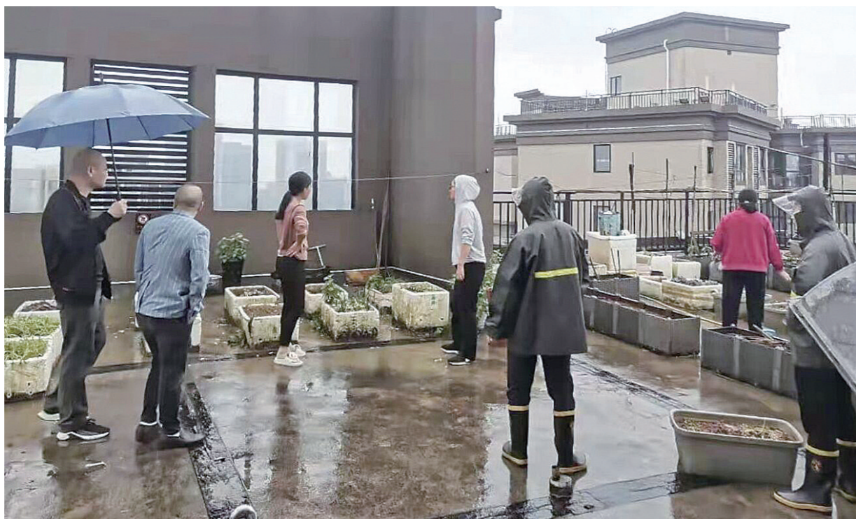
▲御山和苑小区,工作人员冒雨取缔“空中菜园”。

该公司负责人介绍,5月1日至15日,该公司开展募捐活动,筹集善款5万余元,计划为100名低收入残疾人、“一户多残家庭”残疾人、家庭中有在校就读人员需要供养的残疾人、在校就读的残疾人学生及身患疾病需要长期医疗救治的残疾人捐赠电风扇等生活物资。