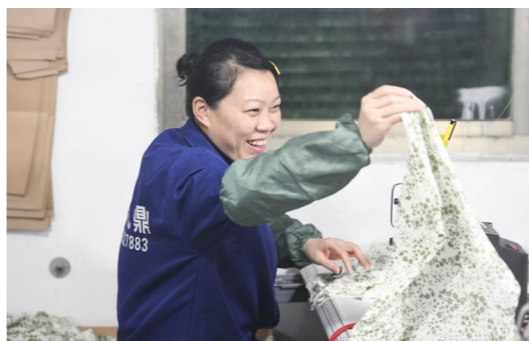
▲偶尔说说笑笑,缓解一下工作疲劳。