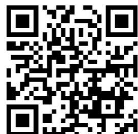
▲扫码可 看来访视频。 视频制作:谢慧