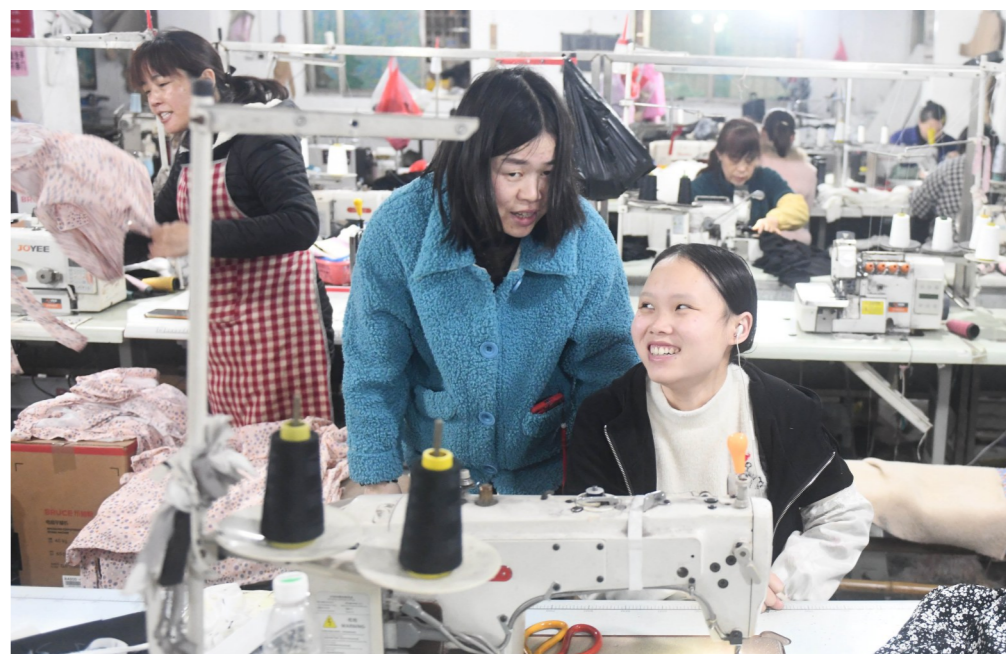
▲难得的一名90后,老板娘视其为宝。