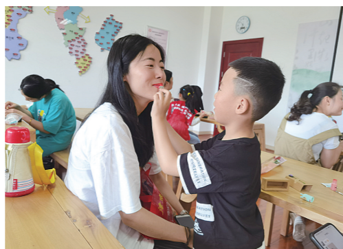
▲为妈妈涂上我做的口红。

母亲节刚过,父亲节也迈着步伐款款走来。所有的家长,曾经是父母的孩子,也曾有过无忧的童年时光;所有的孩子,也会慢慢长大,学会理解父母的良苦用心。沟通与交流,是父母与孩子之间重要的一环,节日成为纽带,让这种亲子时光具有浓浓的仪式感。本报邀请部分校园记者“穿越”成为父母,那么,他们会以怎样的方式对待自己的小孩?都说童言无忌,孩子们的“吐槽”话语,也会给父母以启迪。