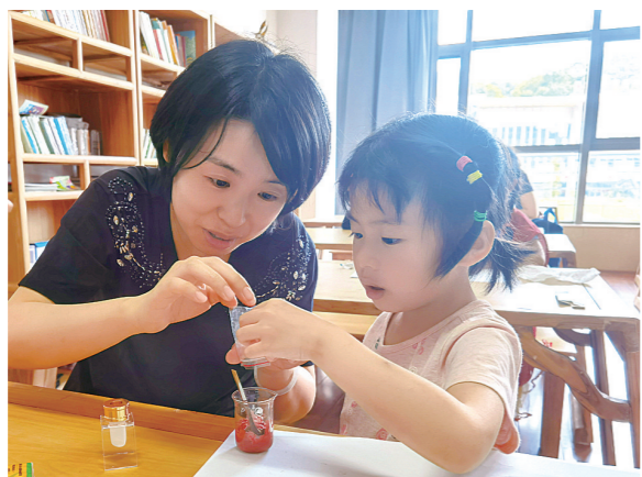
▲口红制作,也是难忘的亲子时光。