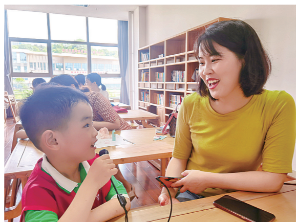
▲宝贝的爱,妈妈已经收到了!