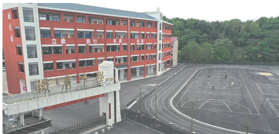
无人机拍摄的铁肩中学外景。

本报讯(株洲晚报融媒体记者 刘平 通讯员 刘丹妮)5月10日上午,市国信公证处完成了一份特殊的保全证据公证,帮助一名目前居住在我国台湾的九旬老人完成“实地考察”醴陵母校的心愿。