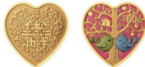
▲3克心形金质“琴瑟和鸣”纪念币正反面图案。资料图

当时时间紧迫,我生怕错过拍卖,于是坐飞机赶往上海。拍卖现场,虽然有不少人举牌,但我志在必得,气势很足,最终一举拿下。当邮封终于拿到手时,我内心真是激动不已,仔仔细细看了又看,摸了又摸,最后再小心翼翼地放在贴身的衣服口袋里,生怕被其他人发现。回到家后,妻子看到我这个小心的样子,忍不住笑我:“在其他人眼里这跟废纸没什么区别,就你把它当宝贝一样。”