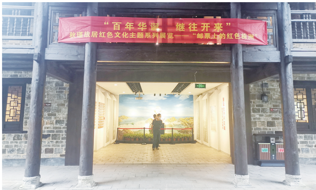
▲5月6日-17日,“百年华诞·继往开来”秋瑾故居红色文化主题系列展览——“邮票上的红色株洲”在秋瑾故居开幕。