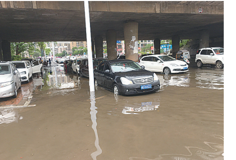
▲路面积水车被困。

本报讯(株洲晚报融媒体记者 刘平)5月11日,受强降雨影响,天元区石峰大桥下的新东路部分路段出现内涝,超过20辆私家车被困在积水中。