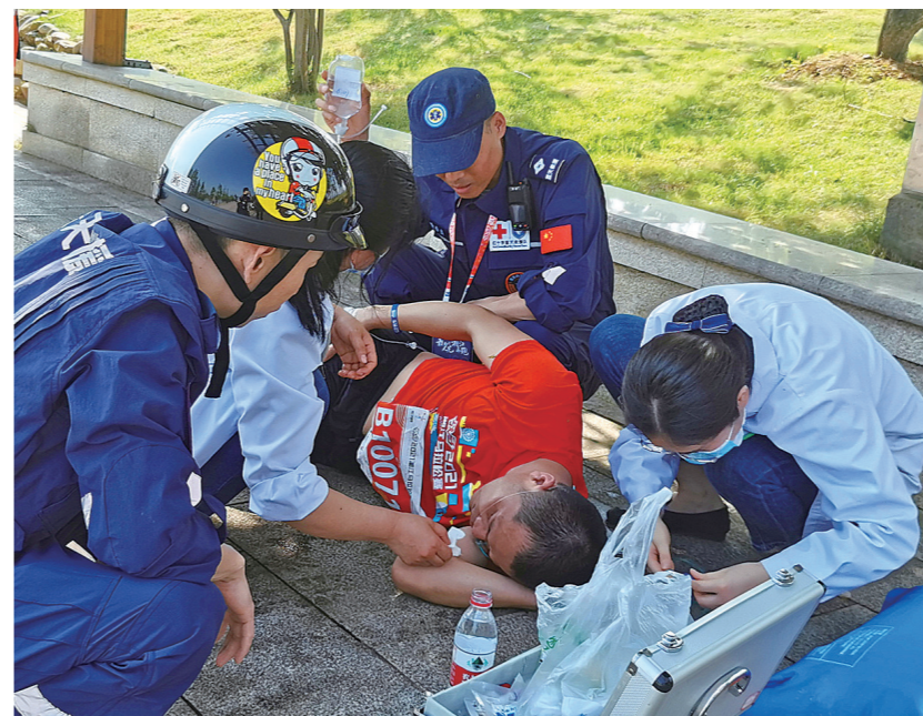
▲医生为昏厥选手进行输液急救措施。

市中心医院工作人员表示,经急救,晕厥选手已经恢复意识,目前正在做进一步住院治疗。