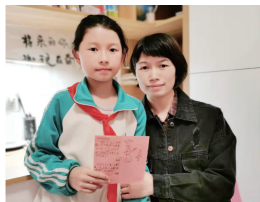
▲最美的爱给亲爱的妈妈

学校相关负责人语重心长地告诉校园记者:“在我们的成长中,妈妈是这个世界上最爱你的人之一。我们每个人要把对妈妈的感激之情、哺育之恩、抚养之美全部转化为对妈妈的爱,好好学习,将来回报妈妈。”