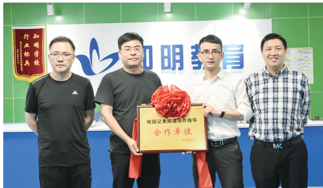
▲图为授牌场景。