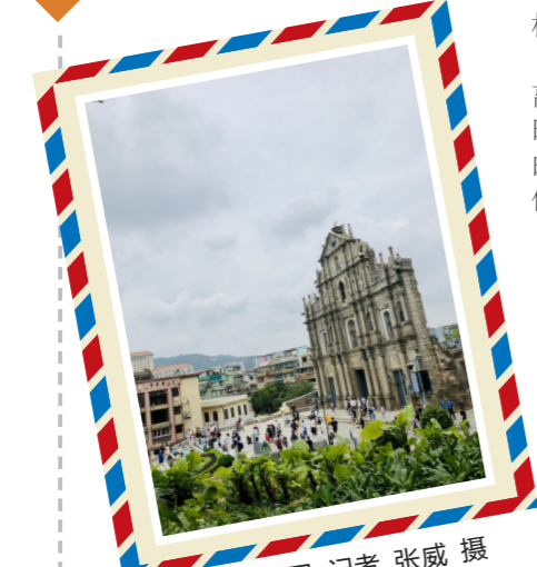
▲澳门大三巴

在众多热门旅游景点中,考虑到疫情、交通等因素,“五一”假期,最终我和家人决定去澳门旅游。