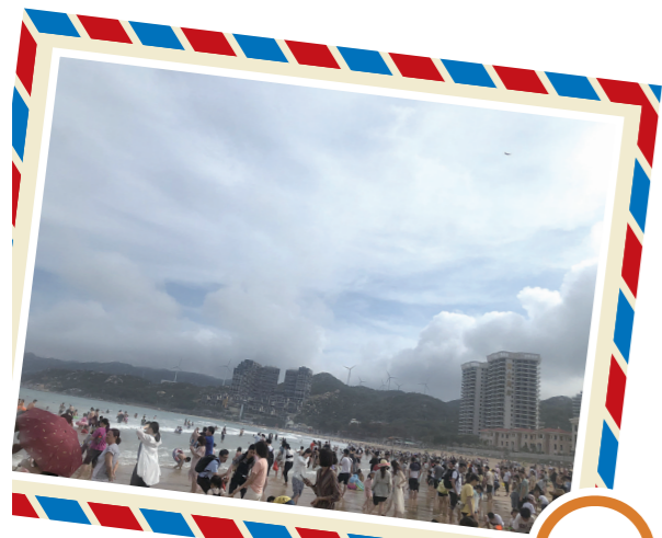
▲汕头南澳岛海滩

作为疫情得到有效控制之后的第一个“五一”假期,各地旅游市场有什么新变化?本报记者为您讲述自身的出游体验。