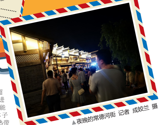
▲夜晚的常德河街 记者 成姣兰 摄

疫情后旅游需求最旺的假期,火的是抗风险能力强的成熟景点,少数冷落已久的景区,还需要时间去修复。