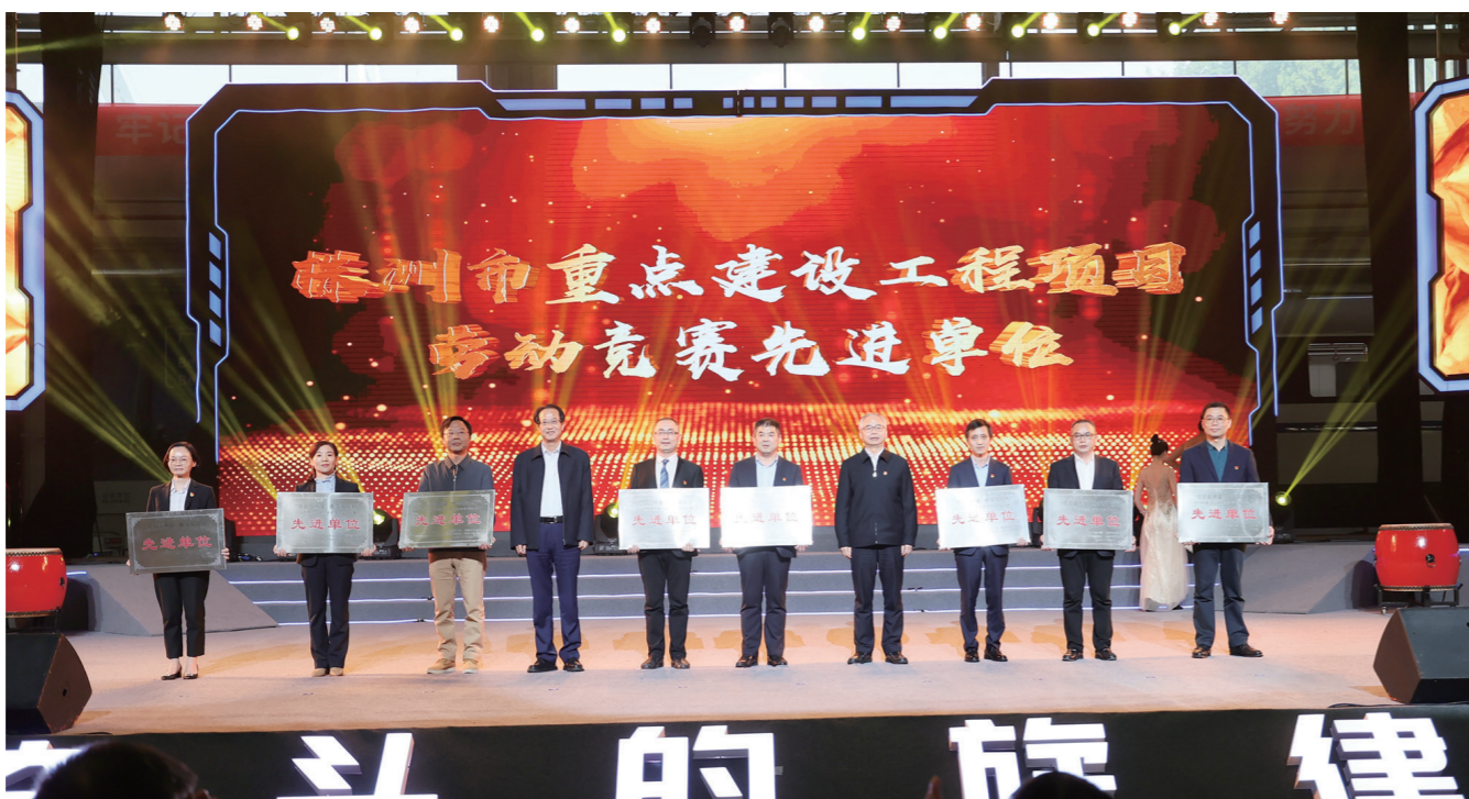
▲颁奖现场。