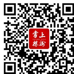
▲扫描二维码查看全部获奖名单。

4月29日,株洲市庆祝“五一”国际劳动节暨先进集体先进个人表彰大会在中车株机机械事业部总成车间召开。在现场,三级劳动模范和先进工作者、历年“五一劳动奖章”获得者及各行业劳动者欢聚一堂,分享劳动的喜悦与荣光。