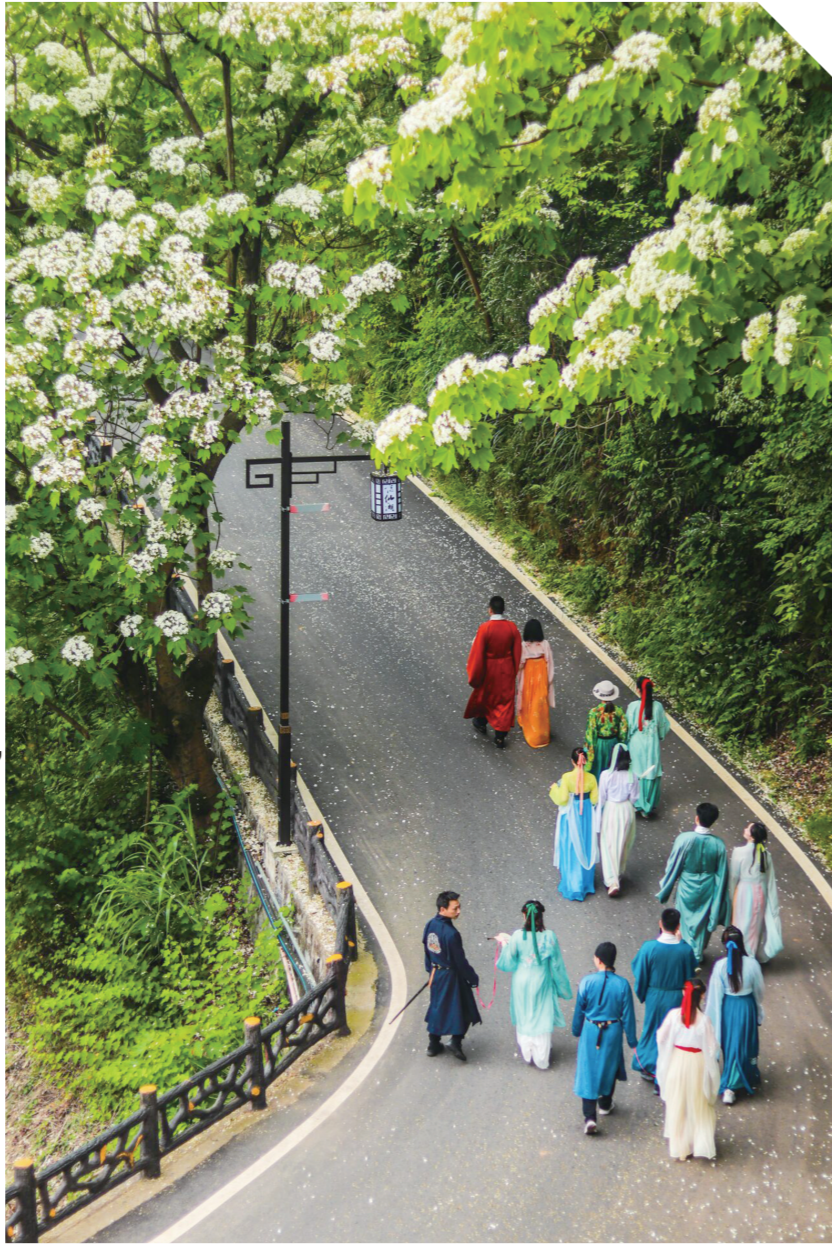
▲去年酒仙湖景区盛开的油桐花吸引了不少游客(资料图片)

本报讯(株洲晚报融媒体记者 温琳 通讯员 龙磊 李茂春)今年,预计将迎来“史上最热”的“五一”假期。来株洲,去哪玩?赏华服、做陶瓷、学党史……今年“五一”期间,株洲各景区纷纷推出主题活动“邀客”,城区内公共文化场馆均正常对外开放,还推出了系列活动。