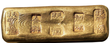
▲民国时期俗称“大”黄鱼”的金条。

“小黄鱼”为312克左右,“小黄鱼”为31克左右。“黄鱼”到底有多值钱?1924年,有人