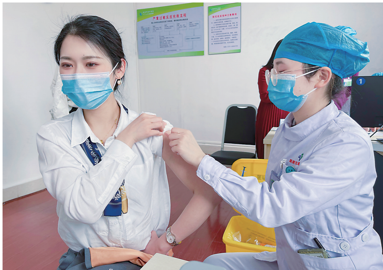
▲市民在市中心医院接种新冠病毒疫苗。

本报讯(株洲晚报融媒体中心记者 刘琼 通讯员 朱卫健)国内疫情偶有发生,境外疫情形势依然严峻,仍需警惕新冠肺炎疫情输入和反弹风险。这为不少仍处于观望状态的民众敲响了警钟:接种新冠病毒疫苗已不是“可选项”,而是“必选项”。