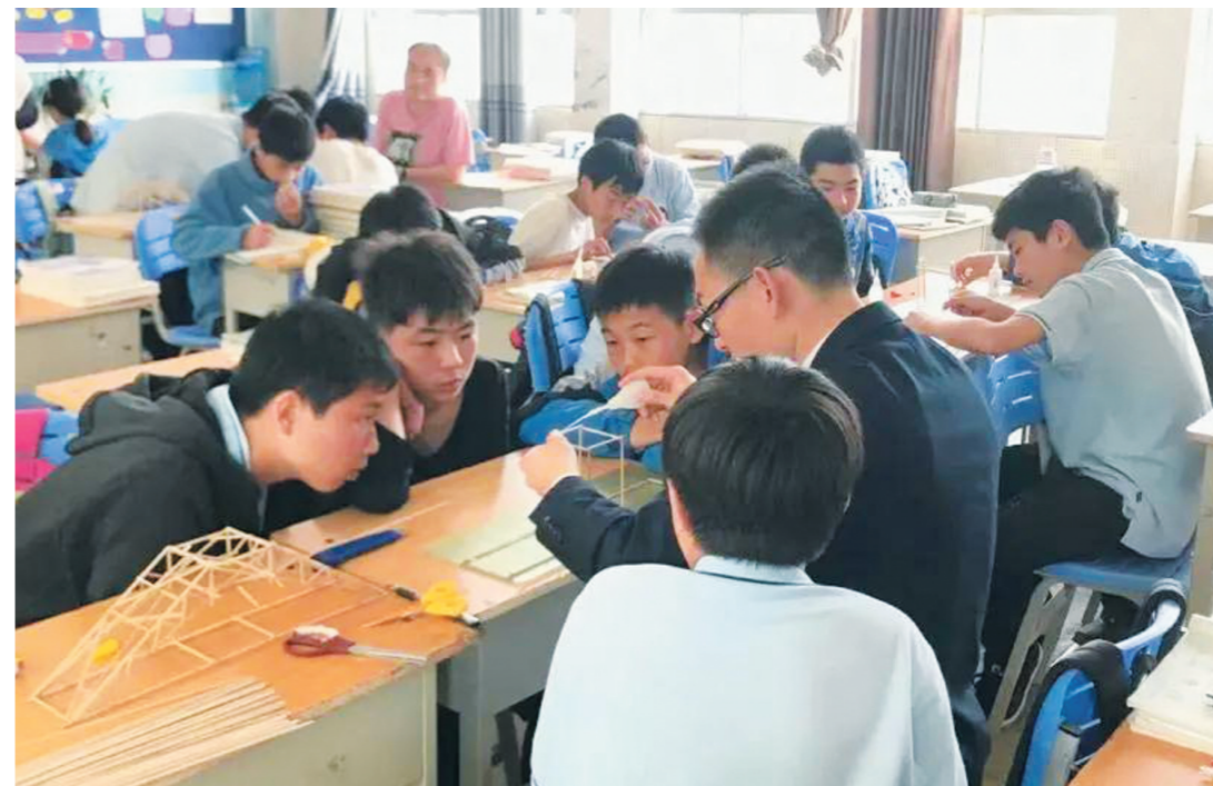
▲木桥承重社团的成员正在聚精会神地研究木桥搭建

午后的健坤外国语学校是恬静的。“叮铃铃——”下课铃声响起不久后,学校生动了起来。