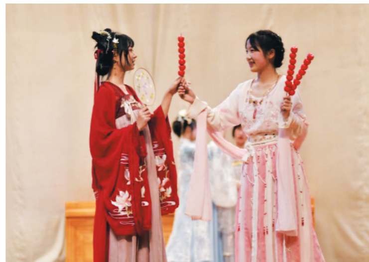
▲汉服社的表演《与子同袍》,展现了传统服饰之美

语言类节目更是将热烈的氛围推向了高潮。《衰草枯杨,青春易过》的朗诵发人警醒;情景剧《中美交锋》再现3月18日举行的中美高层战略对话会,激荡起观众心中的爱国情;话剧《五四风