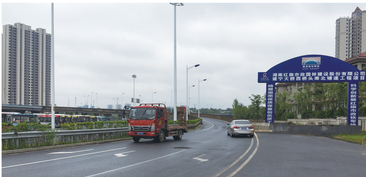
▲一辆小车逆行,驶往建宁大桥。

咨询电话: 聂炜律师,13973309857 张倩律师,18273396450 联系邮箱:421107511@qq.com 律师事务所地址:株洲市天元区庐山路323号明峰银座1栋14楼