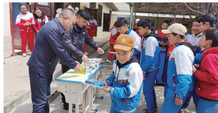
▲株洲教育援藏队为孩子们捐赠学习用品。

今年以来,扎囊县中学“援藏示范班”注重班级文化建设的同时,4名援藏教师结合庆祝建党100周年和西藏和平解放70周年,立足实际,积极引导学生们学党史和新中国史,修好这门人生必修课。