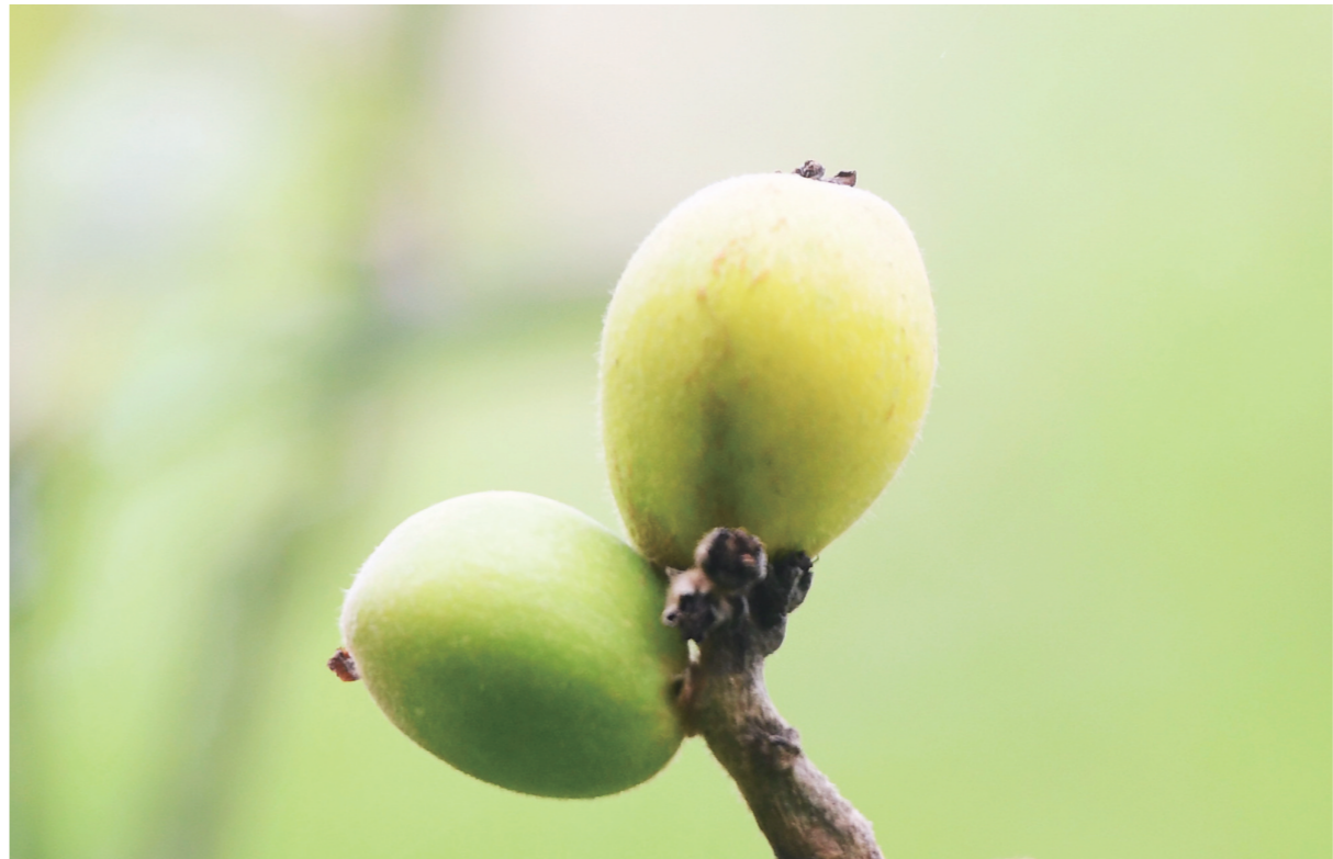
▲4月22日,神农大道附近,黄绿色的枇杷甚是诱人。