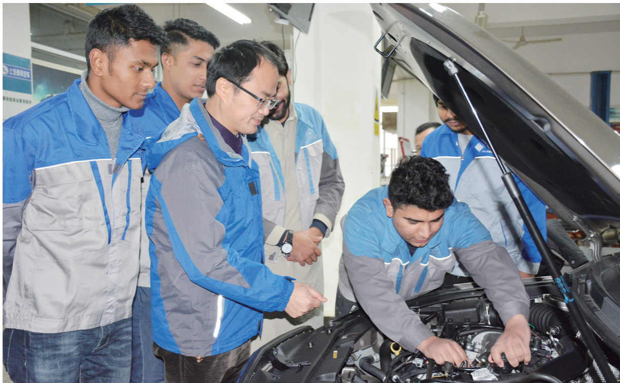
▲外籍学生在湖南汽车工程职业学院学习技能。