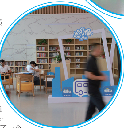
▲市民中心人来人往。夏艰 摄