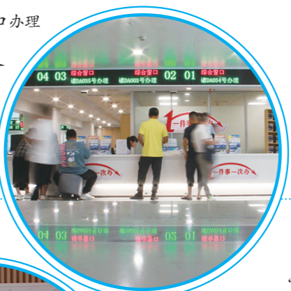
▲市民中心综合窗口。

“数字”如何改变传统的政府服务方式?我们走进市行政审批服务局,感受背后的“智慧”逻辑。