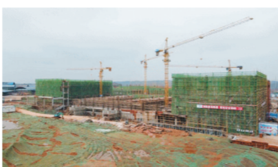
▲长沙市一中株洲实验学校小学部(建设中)及远程集体备课。

值得一提的是,学校师资主要为长沙市一中骨干教师、本地名师和优秀应届生,株洲方面的老师将定期前往长沙本部培训,实现教学课件共享以