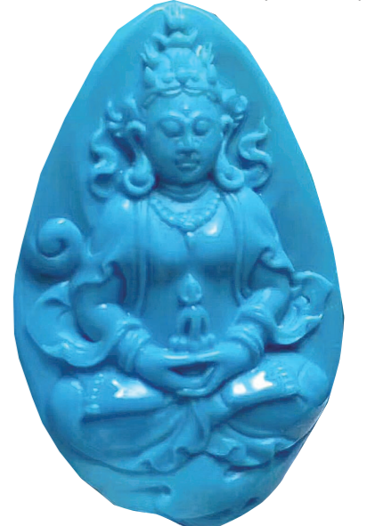
▲云盖寺绿松石制品