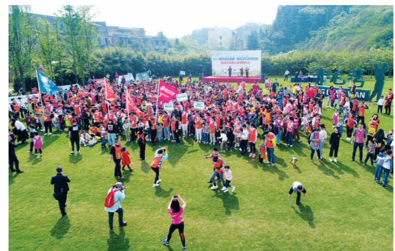
▲小青马活动实景图

2021青龙湾第一届亲子公益马拉松依次经过小镇花海田、农庄、生活馆、奥特莱斯童话小镇,最终到达蓝谷小镇多功能会所,赛程约3公里。比赛现场有一家三口拉着手一起跑,爸爸把孩子架在肩膀上“扛”着跑,还有年轻的爸妈用婴