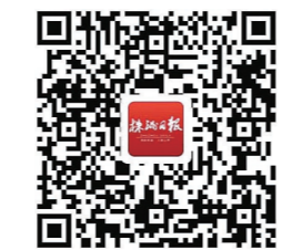
▲扫二维码看视频 制作 廖智勇

更多中青年人意愿立遗嘱,能提前谋划未来,更多思考人生责任,这是好事,能够避免许多不必要的法律纠纷。但是,要让这件好事有好的结果,相应的公共服务、政策法规都需要与时俱进,为更多愿意立遗嘱的人提供方便,也让立遗嘱本身变得更规范。