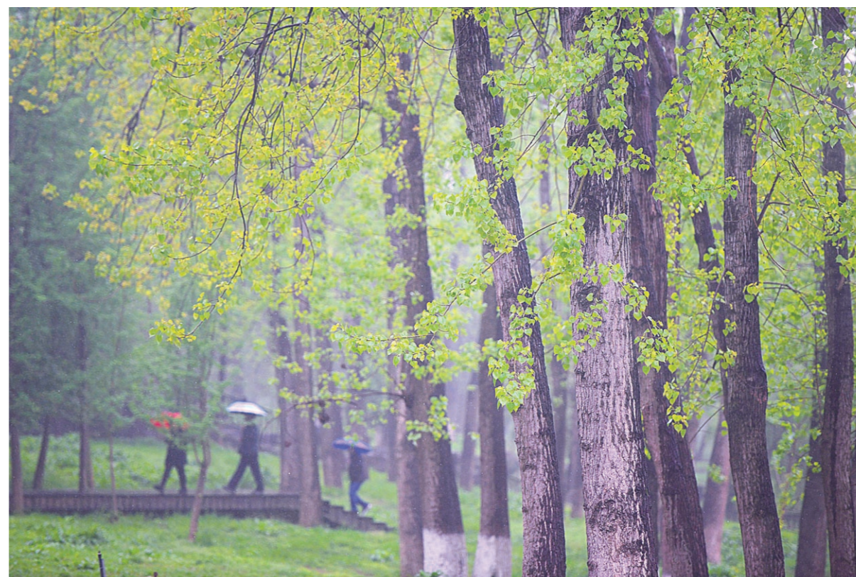
▲近日,河西湘江边,成片的杨树焕发出勃勃生机。