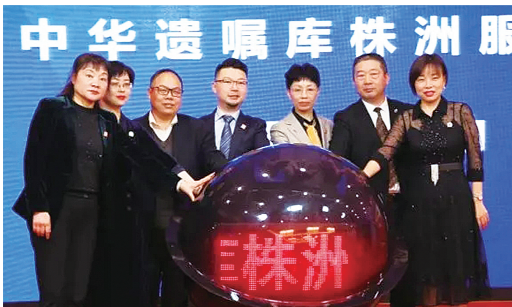
▲中华遗嘱库株洲服务中心成立现场

4月16日,中华遗嘱库株洲服务中心正式挂牌,面向社会提供专业的家族财富保护与传承服务。“遗嘱”被称为生命尽头的规划,遗嘱库在株设点,也让立遗嘱这个充满“悲情色彩”的私人行为引发众多市民关注。