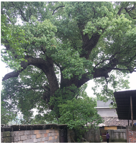
▲古树被砖墙围了起来。

本报讯(株洲晚报融媒体中心记者刘平)4月17日,有市民在芦淞区枫溪街道湘江村樟树湾组发现,当地一棵树龄有600多年的古樟树被村民用砖墙围了起来,看不到古树名木保护牌;围墙内饲养了鸡群,搭建有鸡棚,墙边设有防鸟网。希望相关部门加强监管,规范对这棵古树的养护管理。