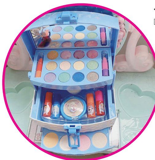
▲小可的化妆桌及化妆玩具。