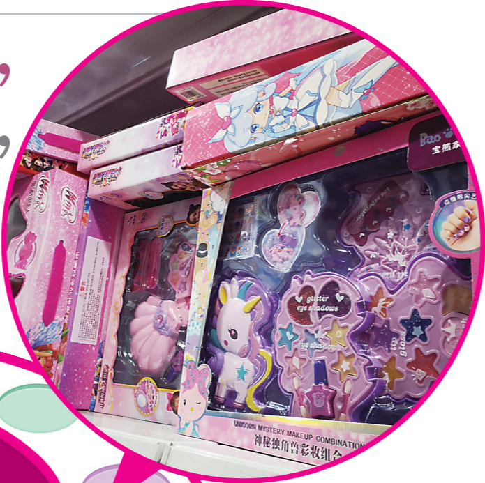
▲玩具商店内,琳琅满目的儿童化妆品摆满货架。