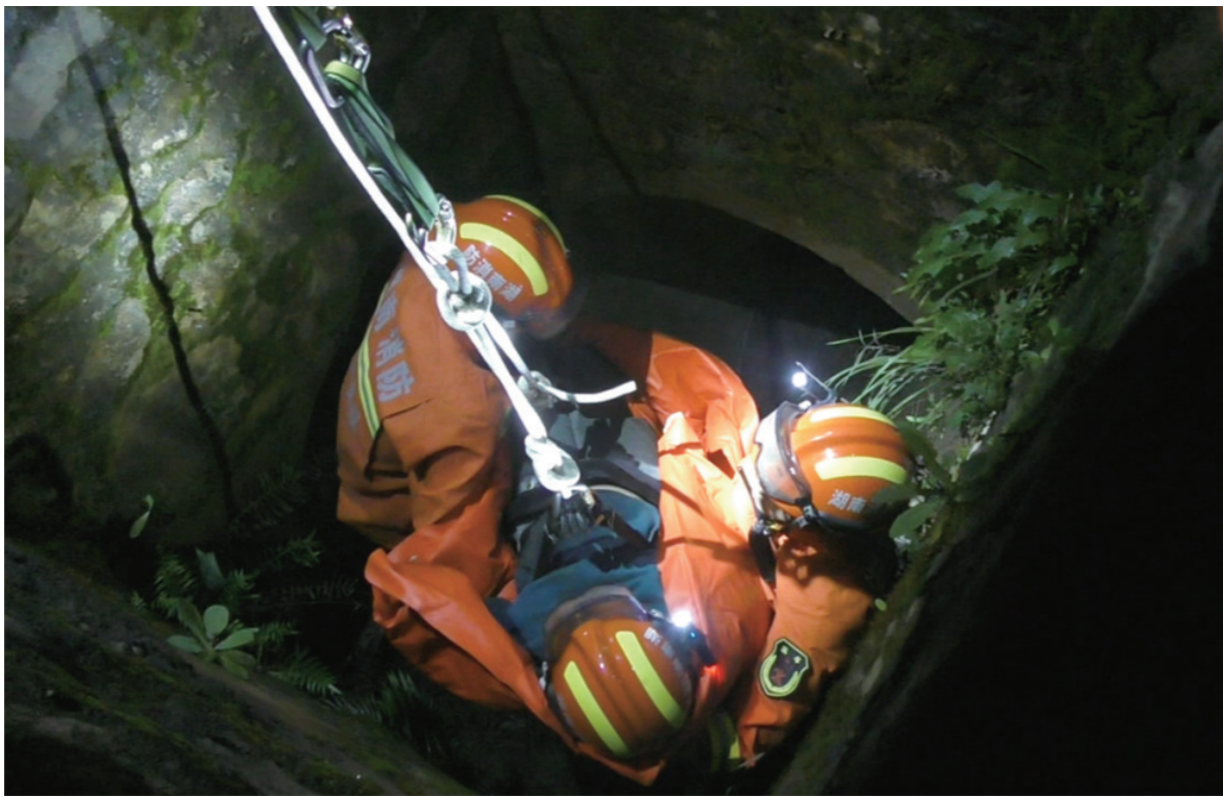
▲消防员下井救起被困女子。