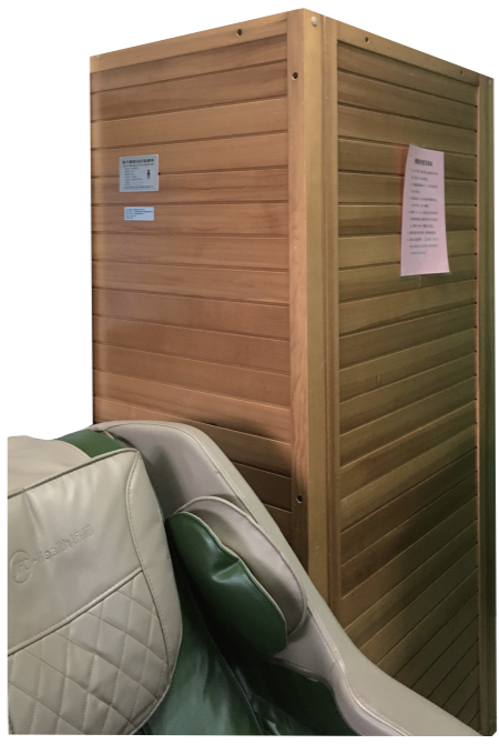
▲骏丰频谱店内摆放的“保健房”,未见标价。