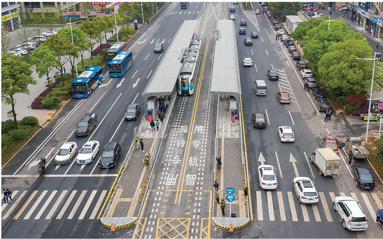
▲3月30日,株洲公交快速廊道正式启用,智轨电车A2线同步进入试运营阶段。

公交总公司相关负责人介绍,快速公交(智轨)廊道已试运营一周有余,结合试运营初期市民反映的问题,以及城市道路交通现状,为缓解道路交通压力,提高运营效率,减少乘客候车时间,4月9日起,T17路、B60路、B70路、B93路、B95路5条常规公交线路上、下行“湖南工大东门站”取消,与公交快速廊道中的“湖南工大站”合并上下客。