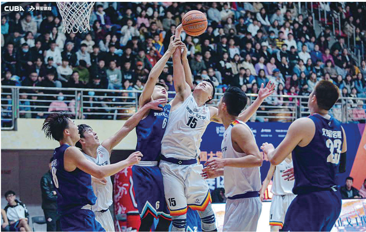
▲湖南工大篮球队的小伙子(白色球服)在赛场上顽强拼搏,展现自我。

对于首次出征机器人竞赛的市特殊教育学校代表队,主办方热烈欢迎并给予了高度重视,除常规培训外,市科协还专门安排了专业老师为市特殊教育学校的教练员进行一对一指导,帮助他们更加清楚比赛规则,掌握得分要素。