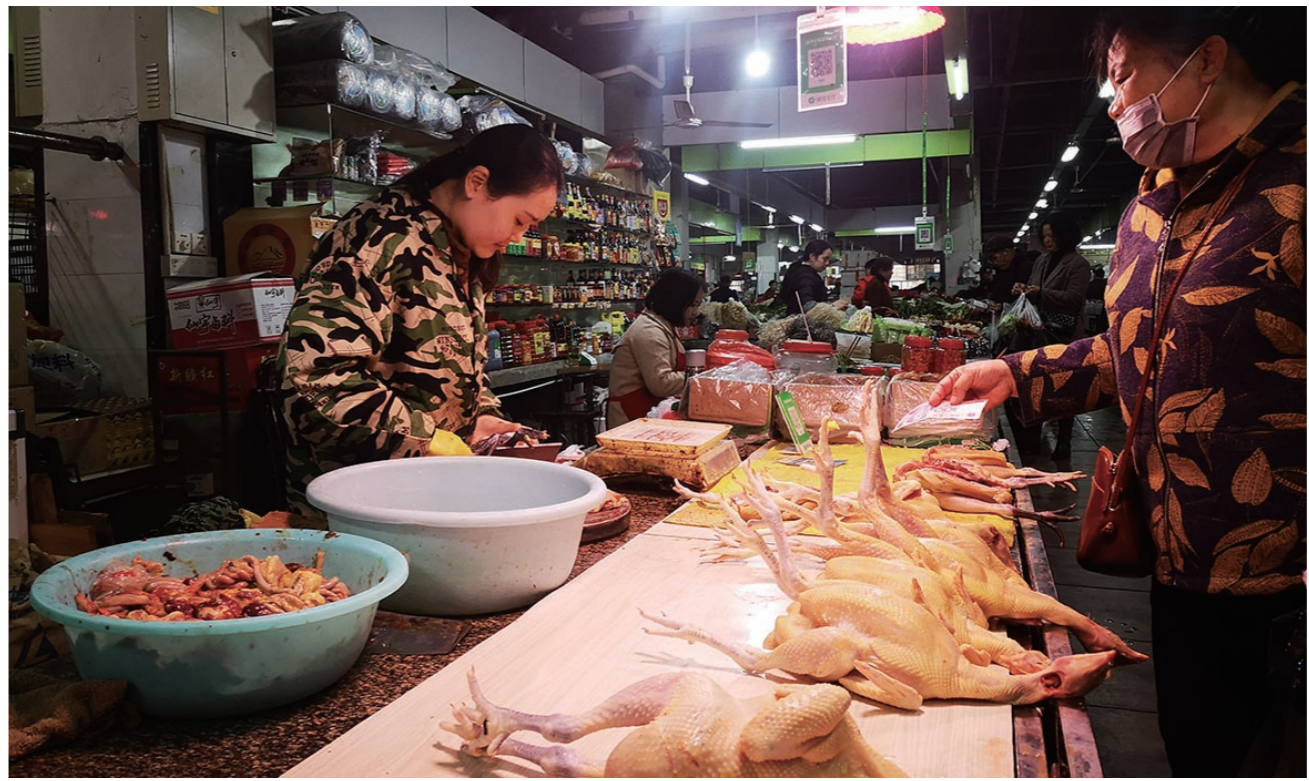
▲我市部分市场禽肉摊位上实行“三隔离”,销售区域仅处理内脏

呋喃西林原是一种人工合成的抗菌药,可用于消毒防腐,但不易代谢。一旦通过动物源性食物进入人体,最长可在人体内留存达2年之久。长期使用可能会诱发各种疾病,导致致癌或致畸胎。因此,呋喃西林被包括我国在内的美、澳等诸多国家列为禁用兽药。