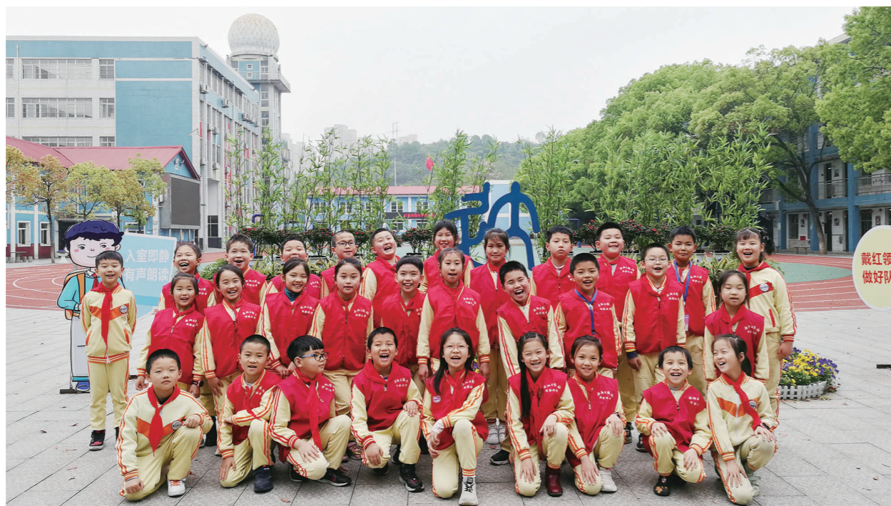
▲校园记者班合影