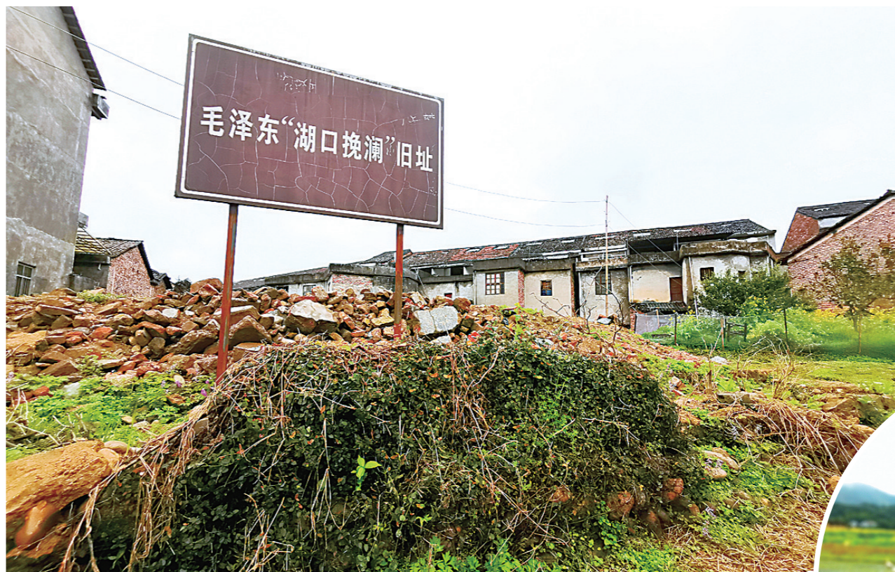
▲“湖口挽澜”旧址

4月23日前全款报名者,报名现场可享受200元/人的现金优惠,还将获赠一份宁夏当地特色枸杞小礼包、一个沙漠防风脖套、一顶新疆特色精美小花帽;旅游途中,将在吐鲁番免费品尝当地特色瓜果,参加篝火晚会时,每团还将免费品尝价值1980元的烤全羊一只。(礼品均为当地赠送,不折现)