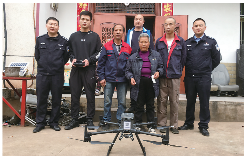
▲红外无人机助力走失老人回家