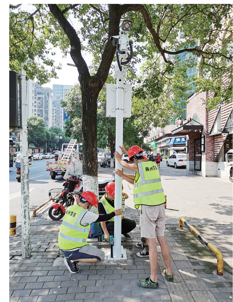
▲“雪亮工程”施工现场

为破解空间屏障,实现烈士“寻亲”梦,我市退役军人事务局主动对接云广边境相关部门,亲赴云广边境,收集在云广牺牲烈士信息和纪念碑影响资料,完善“云祭扫”平台,开通烈士视频远程祭扫直播通道,让烈士能在“云祭扫”平台实现异地祭扫,圆了烈士异地祭扫寻亲梦。