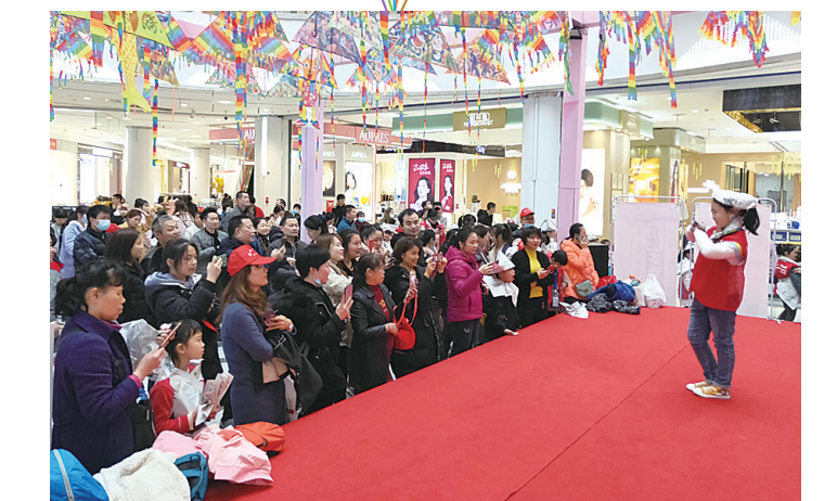
▲勇敢走上舞台,宣传环保理念