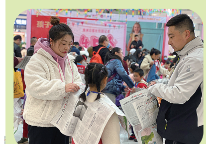
▲准备上台了,妈妈快来帮个忙……

每个孩子的生日,都会成为家庭的一个特殊“节日”。同样,所有校园记者的生日,也成为株洲日报社校园记者俱乐部的最深关切。