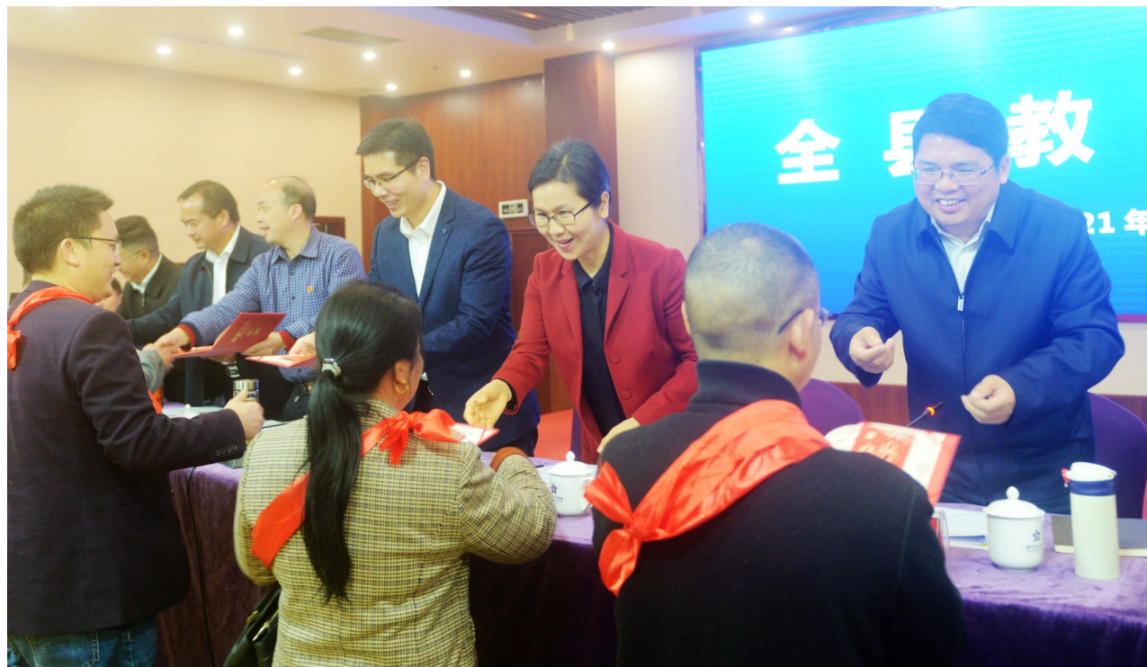
▲全县教育大会,优秀教师和教育工作者受到表彰

加强党的领导、改善办学条件、加强队伍建设、提高教育质量、优化教育服务、促进教育公平……近年来,茶陵教育全面贯彻党的教育方针,全面深化教育综合改革,各类基础教育协调发展,基础教育稳固发展,职业教育内涵发展,教育质量不断提高,教育的社会认可度大幅提升。