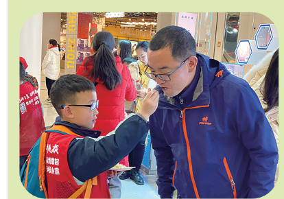
▲“爸爸,尝一口生日蛋糕!”