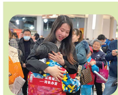
▲生日会上吐心声:妈妈,我爱您!