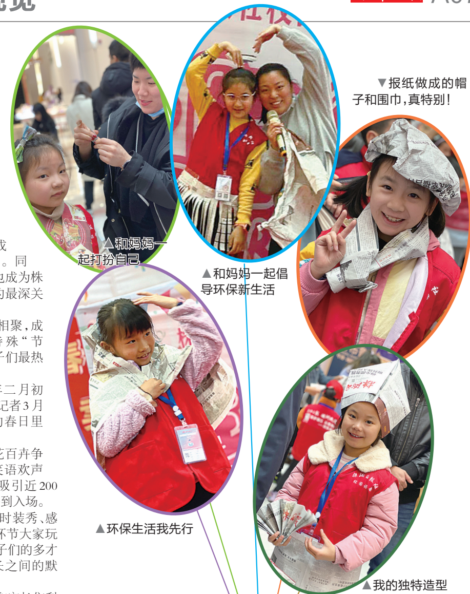
▼报纸做成的帽子和围巾,真特别!