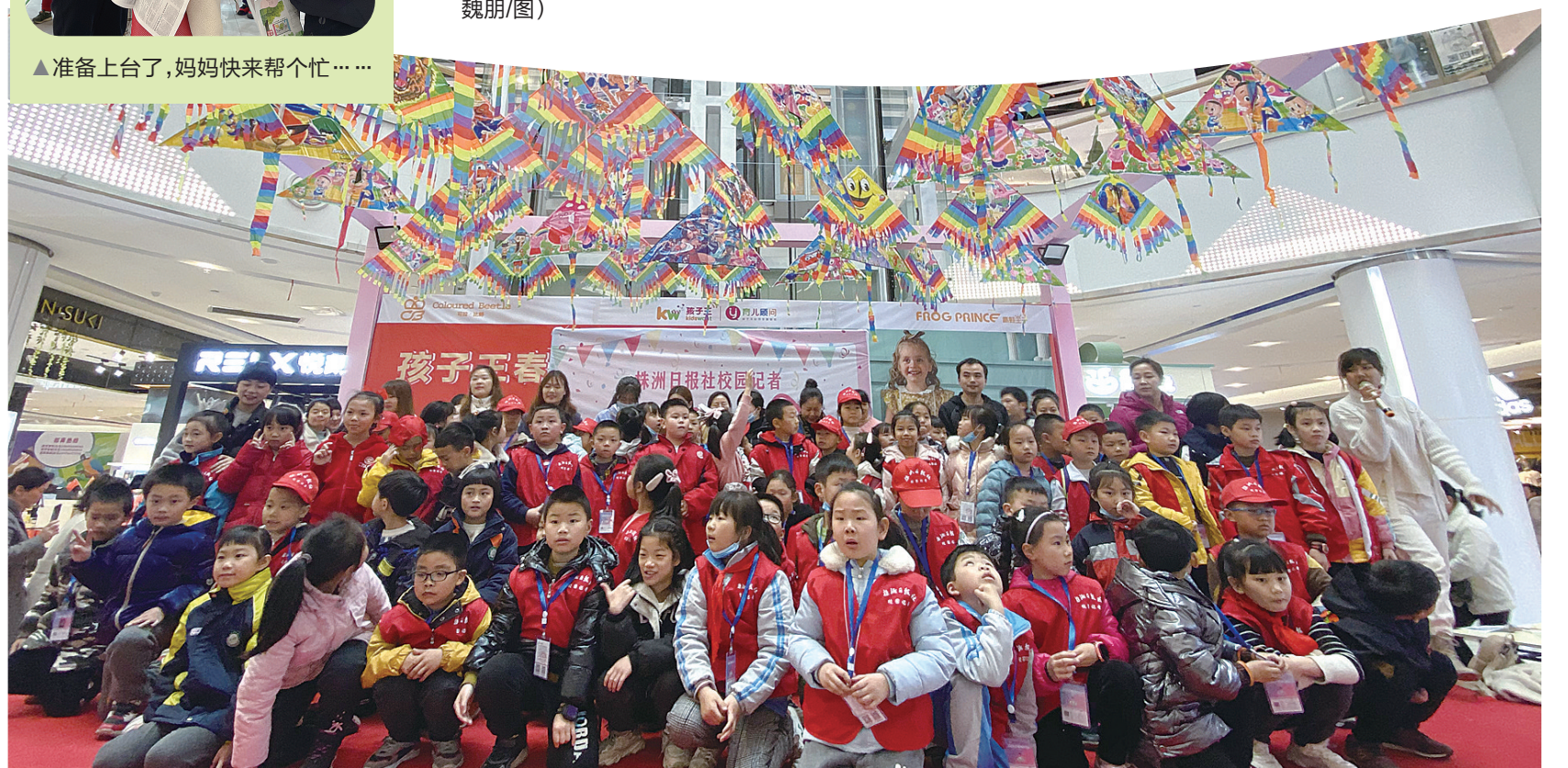
▲大声喊出来:生日快乐!