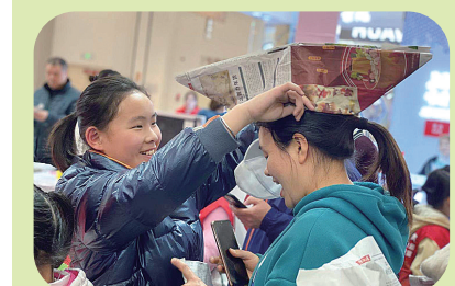
▲家长也被吸引了:“我也要秀一下……”