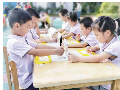
▲校园,成为孩子们的乐园