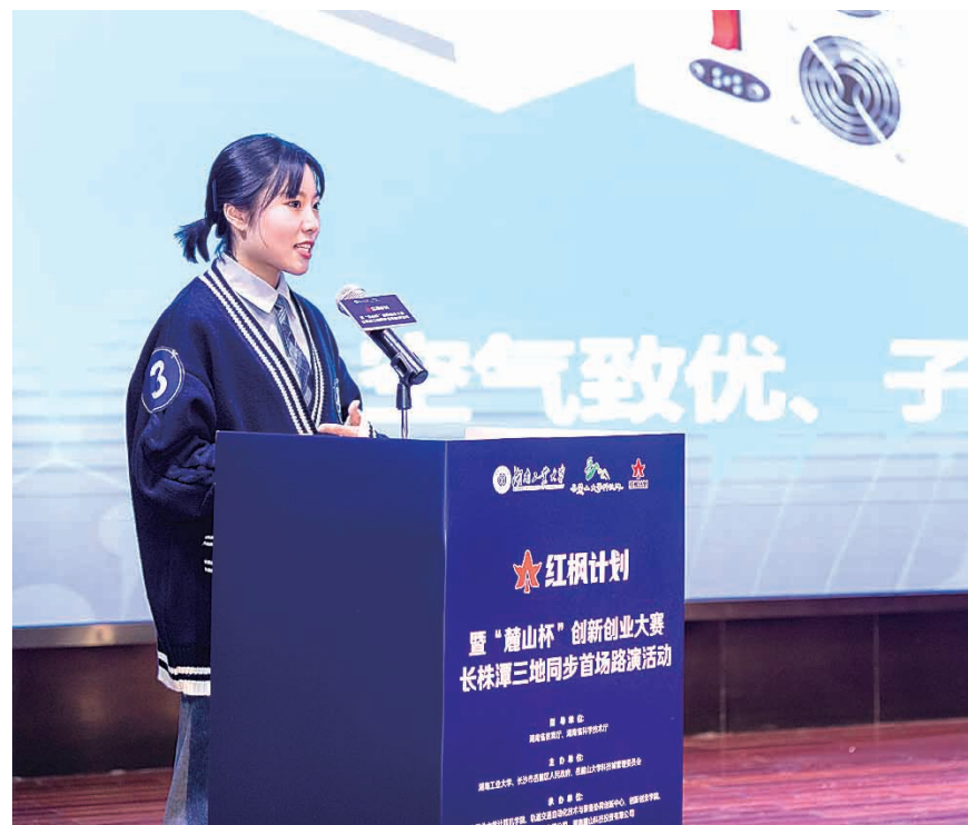
▲湖南工业大学大学生科创团队正在路演

本报讯(株洲晚报融媒体记者 旷昆红 通讯员 胡昊)3月25日,岳麓山大学科技城“红枫计划”暨“麓山杯”创新创业大赛长株潭三地同步首场路演分别在长沙、株洲、湘潭三地赛区同期举行,株洲赛区设在湖南工业大学,6个参赛项目参加路演。