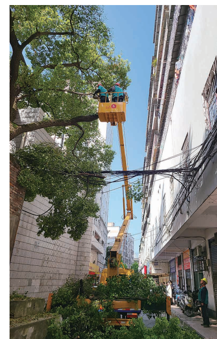
▲芦淞城管园林工人修剪树枝 通讯员供图

本报讯(株洲晚报融媒体中心记者 伍靖雯 通讯员 谢翊 任晓磊)阳春三月,树木生发。但一些靠近小区、没有及时修剪枝条的树木,可能给居民带来安全隐患。昨天上午,芦淞区樟树坪小学附近,芦淞城管园林绿化部门的工作人员就为一棵樟树“理发”。