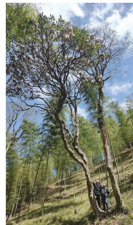
▲林业专家现场考察这棵云锦杜鹃树

本报讯(株洲晚报融媒体中心记者 黎世伟 通讯员 彭绍兴 卢校梅)3月25日,炎陵县林业局工作人员在大院林场做珍稀野生植物调查时,意外地发现一棵胸径36厘米、高为13米,大约500岁的云锦杜鹃古树。