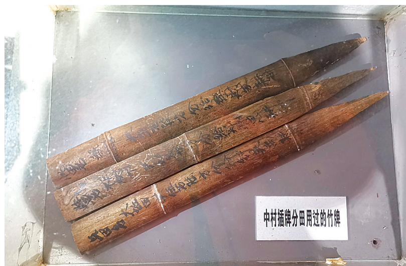
▲当年农民在竹牌上写字标注田地权属

1928年3月,毛泽东率工农革命军来到酃县中村,团部设在了周家祠。而周家祠的百米开外,便是一片名为八担坵的田地。