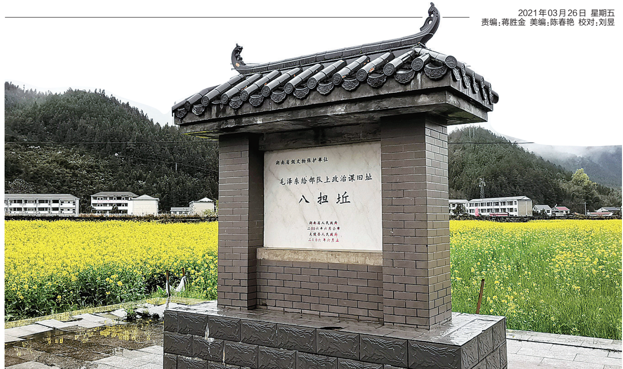
▲毛泽东给部队上政治课旧址已成为省级文物保护单位

1928年3月19日,酃县(现为炎陵县)中村名为“八担坵”的田野,变成了一个巨大的露天课堂,战士们就着禾菟席地而坐,听得入神。这个大“课堂”,还吸引了不少当地的贫苦农民,他们也听得热血沸腾。