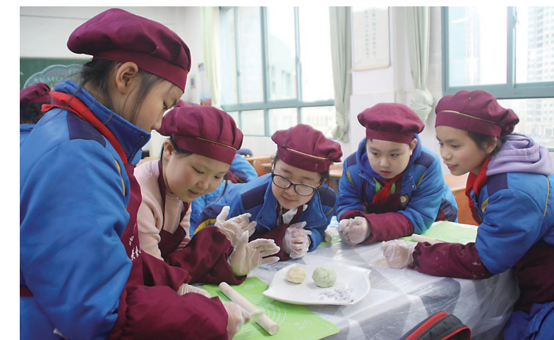
▲学生们分工合作,制作汤圆

里国省干线公路建设项目,推动国省干线公路与高速公路、农村公路、城际干线无缝对接,全力打造快速公路交通网。农村公路是巩固脱贫攻坚成果、推进乡村振兴战略的重要基础设施。今年,该中心还将以“四好农村路”建设为突破口,督促、指导县市区完成“乡镇通三级路”32公里,建设旅游路、资源路、产业路203公里,提升农村公路通行能力,助力农业强、农村美、农民富。