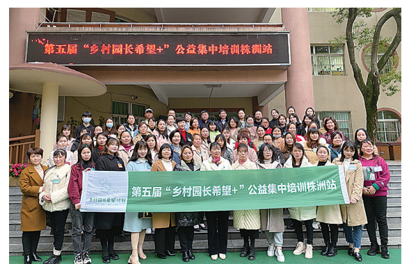
▲ 参与“乡村园长希望+”公益集中培训营的学员与老师合影

本报讯(株洲晚报融媒体记者 郑炜青 通讯员 李雅倩)乡村幼儿园园长如何实现专业蜕变?3月19日上午,“乡村园长希望+”公益集中培训营第五站(株洲)在株洲市幼儿园开班,60名乡村园长(部分园长来自湘潭)齐聚一堂,开启了为期三天的园长专业提升之旅。 “乡村园长希望+”公益集中培训,由湖南省教育基金会联合长沙善行社会工作服务中心、长沙群英会共同发起。在株洲晚报志愿者联合会的协助下,这一项目第一次落地株洲。在开班仪式上,长沙善行社会工作服务中心理事长傅强对项目做了简单介绍。他说,“乡村园长希望+”项目,旨在推动城乡教育均衡发展,弥补国内幼教公益领域空白,助力更多的乡村园长成长。希望通过“幼教+公益”的模式,弥补株洲、湘潭城乡学前教育之间的差距,弥补乡村学前教育教育的不足,更好地为乡村幼儿园、乡村的孩子服务。 株洲市教育局、市教育基金会有关领导参加了开班仪式。市教育基金会副理事长晏贤明说,该项目主要聚焦乡村园长再教育问题,落地株洲,必将在改善我市乡村学前教育环境方面起到重要作用,助力我市乡村振兴。 株洲晚报志愿者联合会秘书长黄金介绍,助力乡村振兴,提升乡村幼教水平是本项目的主要方向。下一步,株洲晚报志愿者联合会将加强与各级社会组织的合作,引进更多好项目落地株洲,为促进乡村振兴贡献株洲公益力量。