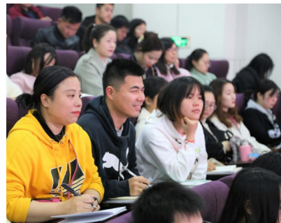
▲“深度学习”教学改进培训现场

本报讯(通讯员 黄亮 余颖 赵莹)3月14日,云龙示范区组织开展中小学教师“深度学习”教学改进培训活动,全区中小学教师400余人参加培训。