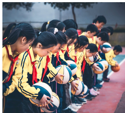
▲旭日小学学生校园练习篮球

球场上奔跑的快感,队友间拼搏的默契,滑落的汗水,胜利的欢呼,都是你最好看的模样。该活动旨在倡导“全员参与、激发兴趣、提升水平”,满足校园广泛开展篮球运动的需要,激发小学生对篮球运动的兴趣,提高学生的身体素质。芦淞区篮球协会与旭日小学约定,每周五实施“篮球进校园”公益活动,承接学校篮球社团和篮球校队教学。当日,该校六年级的学生在校园开展篮球游戏互动,教练员还为校队队员进行手把手教学,指导篮球运球正确动作,帮助掌握动作要领。