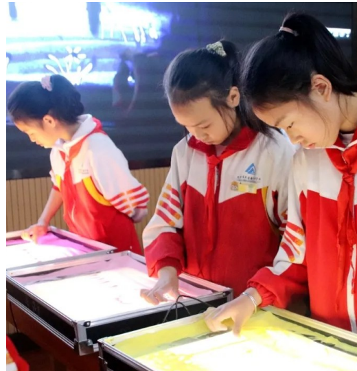
▲学生现场展示沙画

市教科院副院长帅晓梅建议更多的美术老师能系统接受沙画创作培训,学校在沙画艺术推广过程中,要打破学科间的壁垒,加大学科融通。