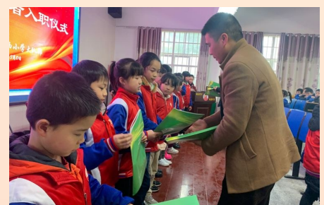
▲入职仪式上,学子们得到《未来作家》特刊

学校负责人表示,株洲日报社校园记者俱乐部为城西小学的孩子们开辟了全面成长的新阵地,提供了另一个学习成长的好平台。下一步,城西小学的校园记者们将在实践活动中锻炼自己的能力,提高自身的本