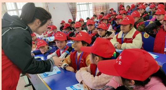
▲辅导老师现场传授采访经验

本报讯(通讯员 吴青)一起交流什么是校园记者,如何写好一篇稿件,老记者为新记者示范采访开场白……3月11日,茶陵县解放学校举办2021年度校园记者入职仪式。