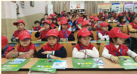
▲入职第一课,红旗路校园记者们仔细聆听

本报讯(通讯员 帅雅玲)“如何成为一名合格的校园记者?如何正确地写新闻……”3月15日,红旗路小学举办校园记者入职培训第一课。