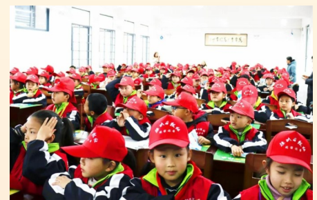
▲成为校园记者,孩子们难掩兴奋之情

杨爱香表示,学校以“最美的教育成就最美的你”为办学理念,携手株洲日报社,利用丰富的媒体外联资源,秉承公众媒体