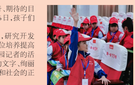
▲启动仪式上,孩子们争相提问