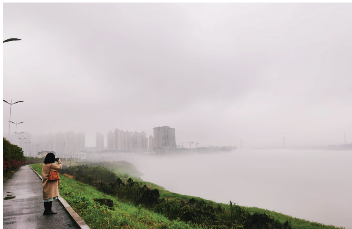
▲3月15日上午,湘江之上雨雾弥漫,白雾笼罩江面,大桥及岸边的高楼仿佛披上轻纱,隐约朦胧