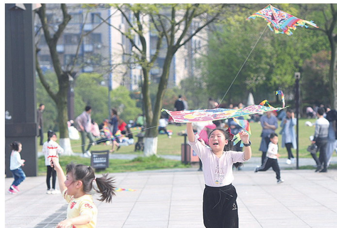
▲孩子们在神农广场快乐地放风筝