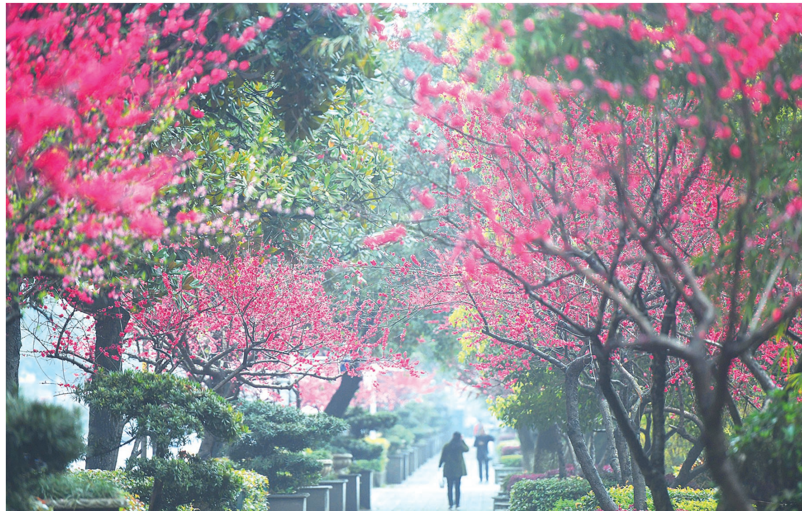
▲3月16日,建设路贺家土路段,红彤彤的桃花是这条街最美的风景