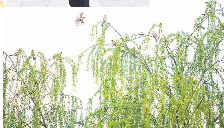
▲鸟儿在柳树上欢快地歌唱