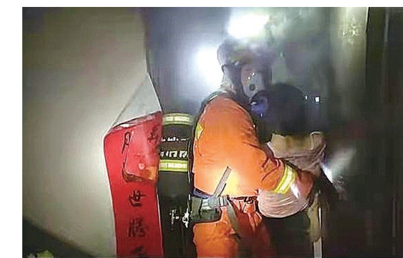
▲消防员救出被困小女孩

本报讯(株洲晚报融媒体记者 马文章 通讯员 颜雨彬)“攸县丽水山庄小区B10栋3单元一户突发大火,火势已烧到客厅,屋里有5人被困,请你们快点来!”3月15日凌晨5时许,攸县消防救援大队接到报警,立即调派消防救援力量赶赴现场。