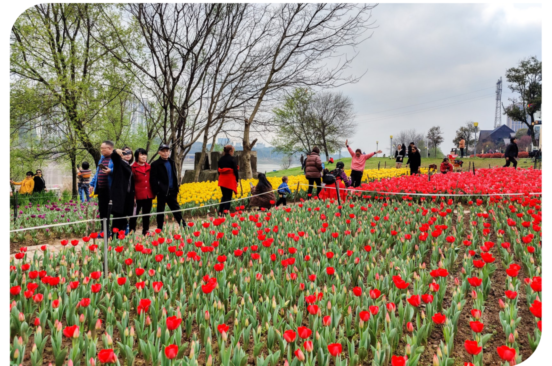
▲花香惹人醉,市民自觉走在游客步道拍照赏花

“请大家文明赏花,不要跨过警戒线进入花丛中……”个别游客蹿进花丛中拍照,现场保安拿着话筒劝导。更有甚者为了沾着花朵摆造型,不惜随意拉扯、采摘花卉。