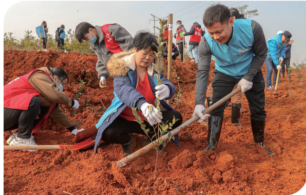
▲3月12日,植树节,芦淞区枫溪街道曲尺村义植树基地,近千名市民栽下一株株苗木