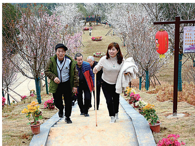
近日,芦淞区大京婆仙岭樱花园盛大开园,游人如织。我和朋友们边游园边拍照。