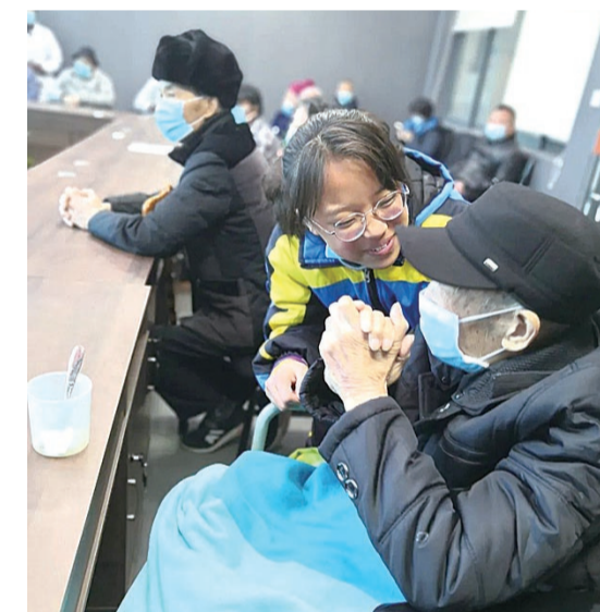
▲中学生陪老人聊天