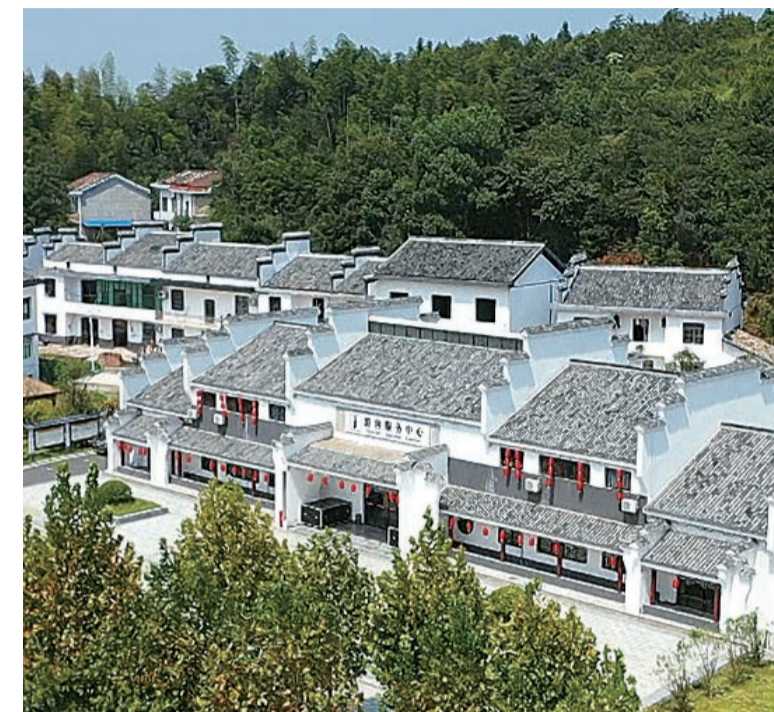
▲省级精品乡村隆兴坳村