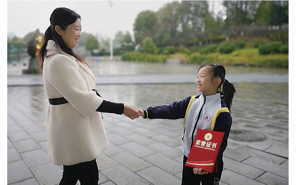
▲12月27日,一名家长领到奖后与孩子分享喜悦